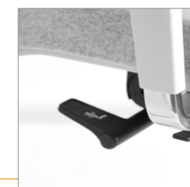
Hendel voor het Synchronmechaniek voorzien van drie mogelijkheden: Actief en/of passief of vast