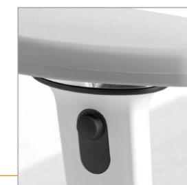
Drukknop voor de hoogte instelling van de draibare armlegger