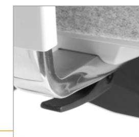
Hendel voor breedte-aanpassing