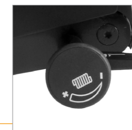
Draaiknop voor de tegendruk instelling van Synchronmechaniek