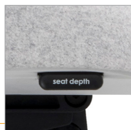
Drukknop voor de zitdiepte verstelling