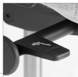
Hendel voor de zithoogte verstelling