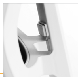
Drukknoppen voor de rughoogte verstelling (inclusief lendensteun verstelling)