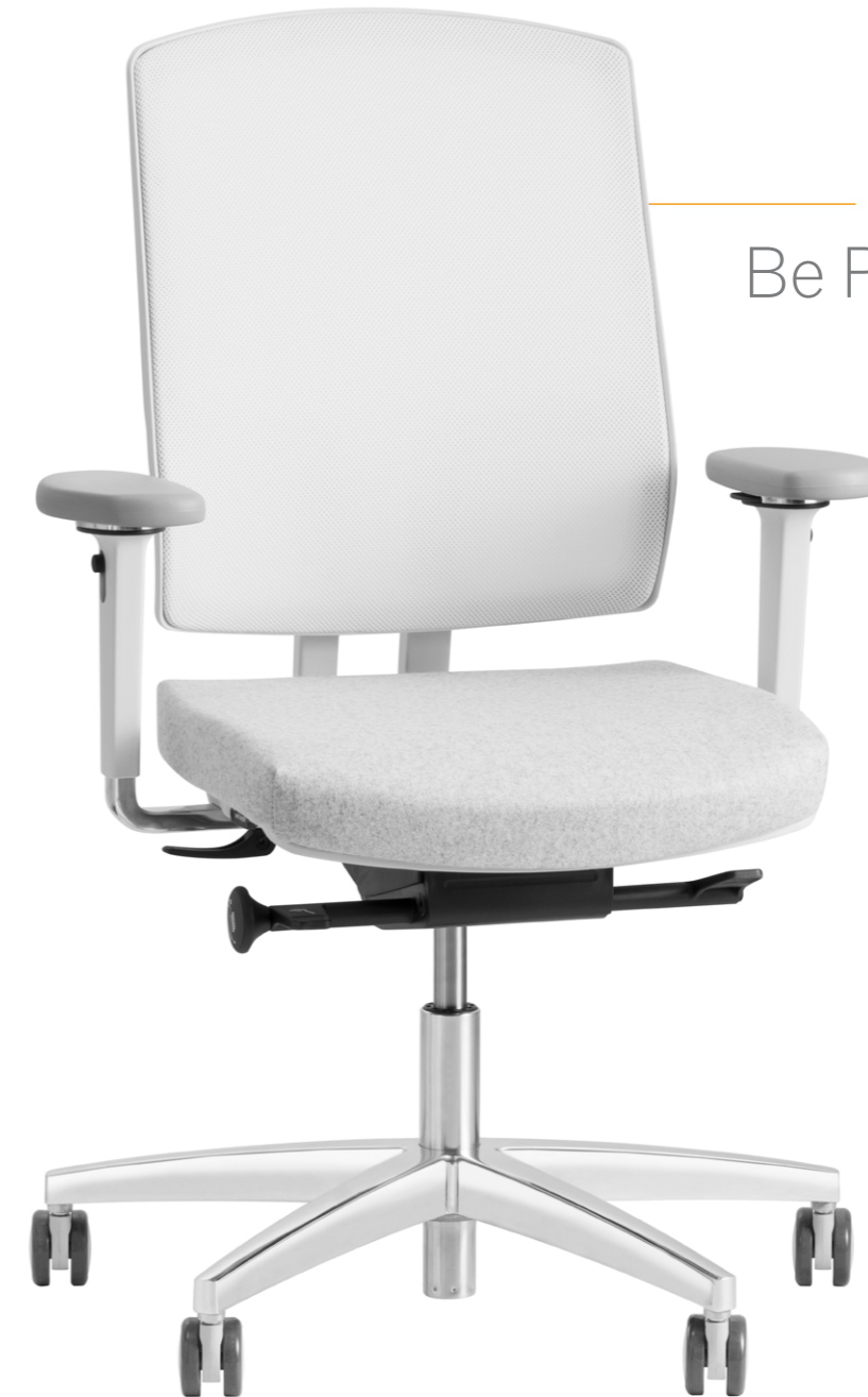
Productinformatie Be Proud 300

Wij willen jou en je collega's gewoon goed en prettig laten zitten. Dit doen we met een 100% Nederlands assortiment van kwalitatief uitstekende, groene, intuïtieve en mooi vormgegeven ergonomische zitoplossingen.